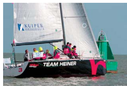
Sponser: Team Heiner pups

Afmetingen: 11 bij 3.80 meter € 1.500,- 13 bij 4.00 meter € 1.765,- 15 bij 5.00 meter € 2.035,-