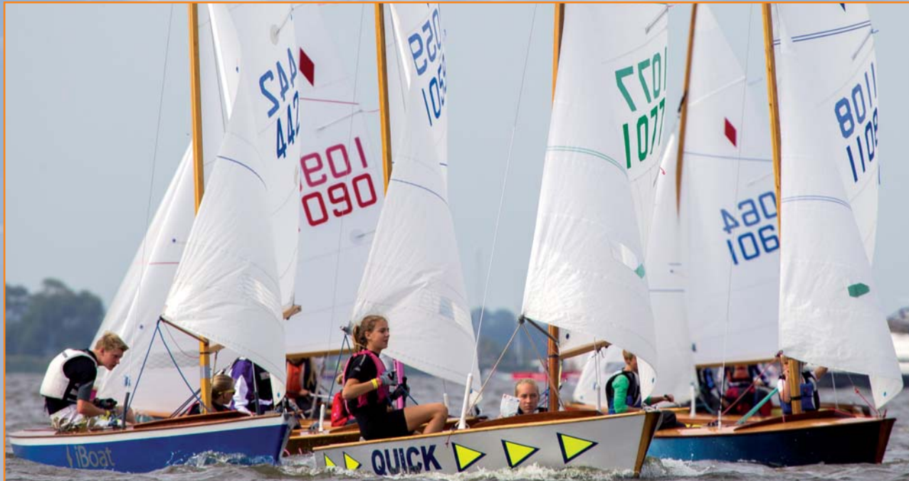
Komend seizoen is er een intensievere samenwerking met de Flitsclub om ook voor die groep het trainingsaanbod te vergroten.

Wedstrijdzeilen als een volwaardige sport, dat is waar de KWS naartoe werkt. Vergelijk het met sporten als volleybal, voetbal, hockey of atletiek. Het betekent door-de-weeks trainen gedurende een groot deel van het jaar. Met een coach aan 'de zijlijn' bij de wedstrijden. In het trainingsprogramma zit een opbouw met aandacht voor motorische ontwikkeling. En niet te vergeten, teams met vrienden en vriendinnen. Want is sport ook niet vooral bedoeld om sociale binding te hebben?