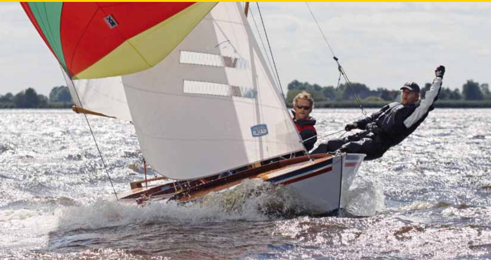
Tekst Gerhard Bouma