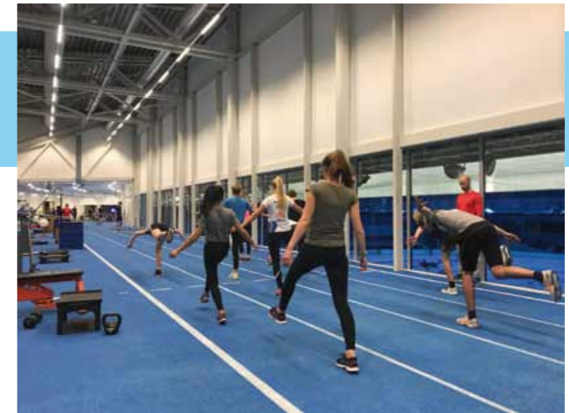
door Koen van Esch

Getalenteerde zeiljeugd wordt meer en meer atletisch. Hun fitheid maakt verschil in wedstrijden. Niet alleen om blessures te voorkomen, maar vooral om uiteindelijk harder te varen. Want wie verder en langer kan hangen, vaart harder aan de wind. Daarvoor is kracht en uithoudingsvermogen nodig. En sterke schouders zijn zo een must voor het snel hijsen en strijken van de gennaker. Met een topconditie ben je in je laatste wedstrijd nog fris; kun je nog hard varen én helder denken.