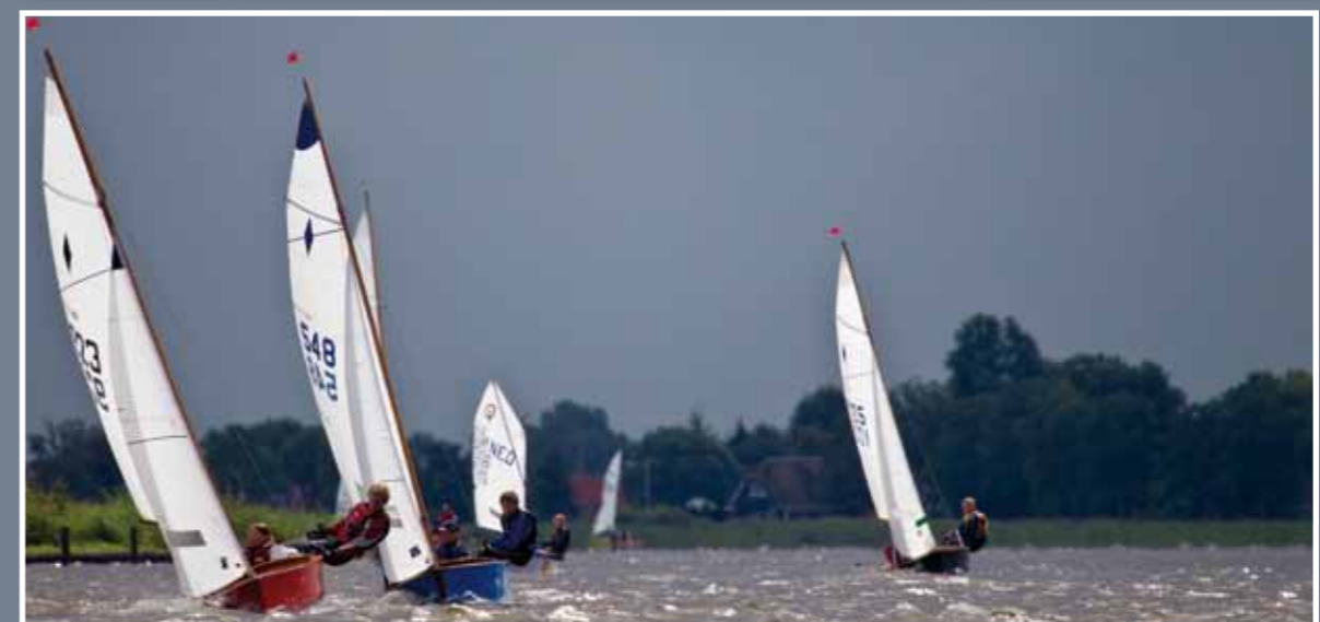
De Koninklijke Watersportvereniging Sneek is opgericht op 1 juni 1851 en is aangesloten bij het Watersportverbond