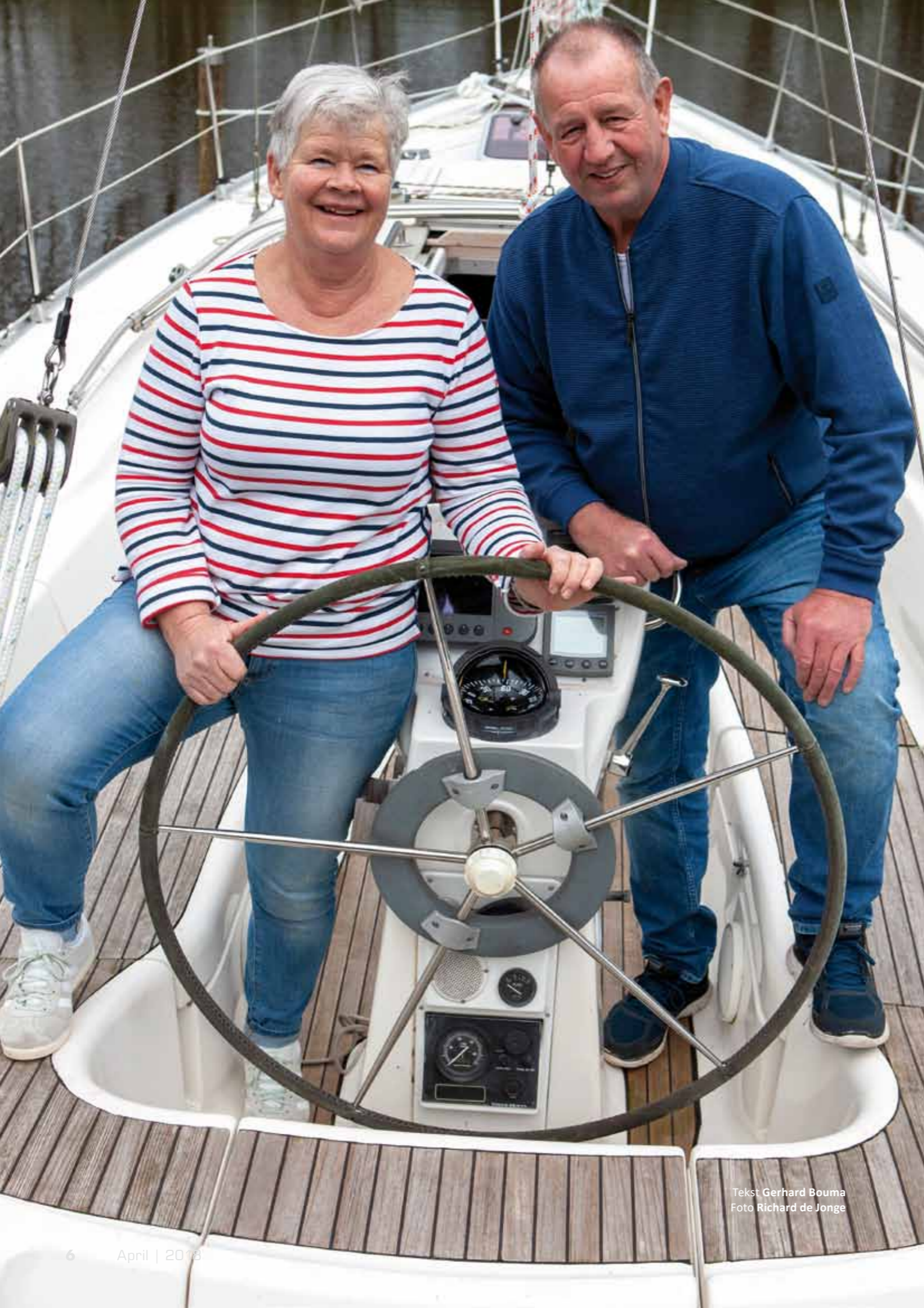
Tekst Gerhard Bouma