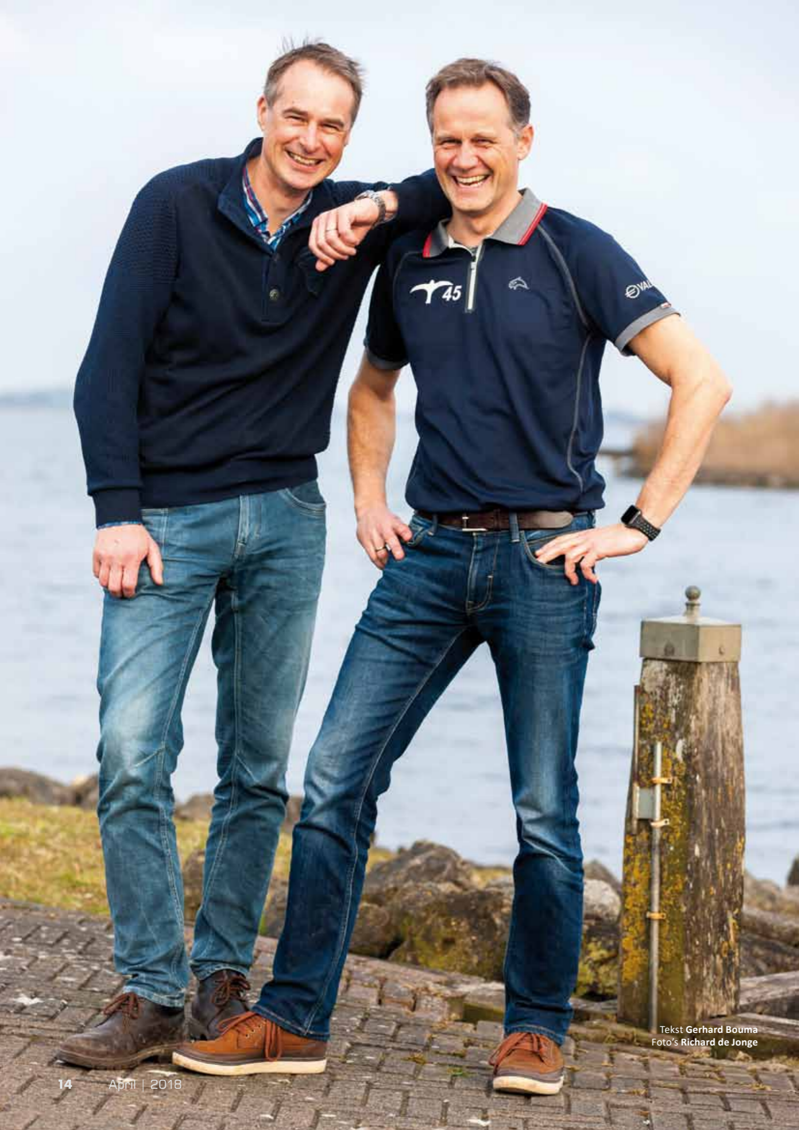
Tekst Gerhard Bouma