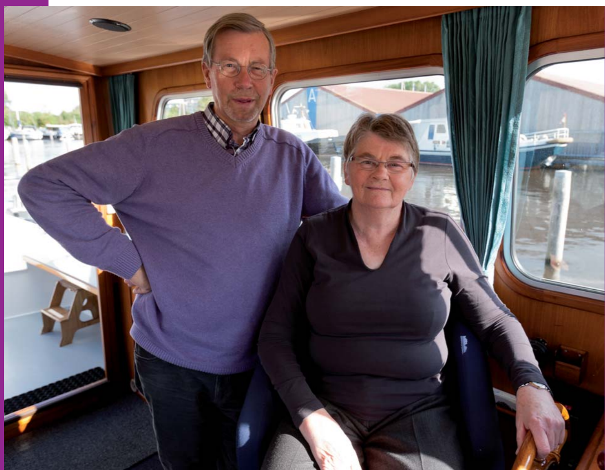
Tekst Amerens Schurer

Bij binnenkomst val ik meteen met de deur in huis: “Voordat ik het vergeet, hebben jullie digitale foto's van jullie reizen gemaakt?” “Foto's wel, alleen niet digitaal”, antwoordt Ellie. “In 2008 is onze camera verloren gegaan, bij het ontwikkelen bleken we de foto's van voor de Moezel wel te kunnen ontwikkelen. Echter alle foto's daarna...” De Moezel is een rivier die door Duitsland, Luxemburg en Frankrijk loopt. Onderhand bekend terrein voor Klaas en Ellie. “In 2011 hebben we het westen van België en het noordwesten van Frankrijk bevaren. Op de Vlaamse steden na was deze tocht niet zo indrukwekkend als de reizen in 2006 en 2008. Veel havens buiten de grote steden waren dicht, oud en er lag veel schroot.” Drie fotoboeken komen tevoorschijn met indrukwekkende foto's.