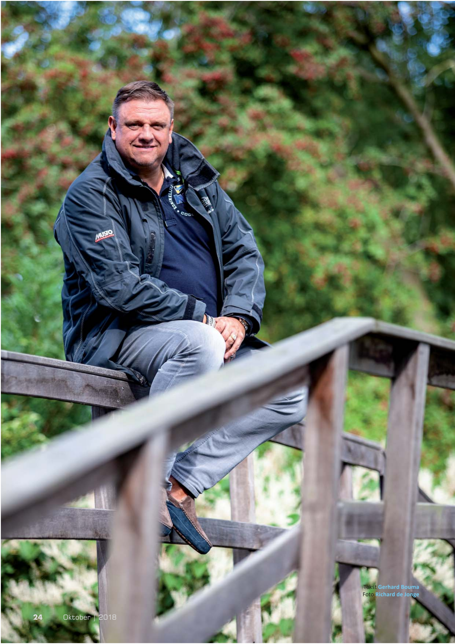
Tekst Gerhard Bouma