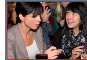
Gaan we voor donker

Roddel van de avond: De functie-eisen voor alle vrouwelijke comitèleden gaan op de schop!