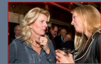
...of voor blond?